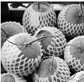
野菜運搬 メロン、桃、イチゴ、等