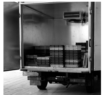
食品運搬 豆腐、冷凍食品、一斗缶、ドラム缶、コンビニ運搬、等