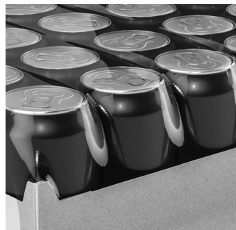
飲料水運搬 缶ビール、瓶ビール、牛乳、等